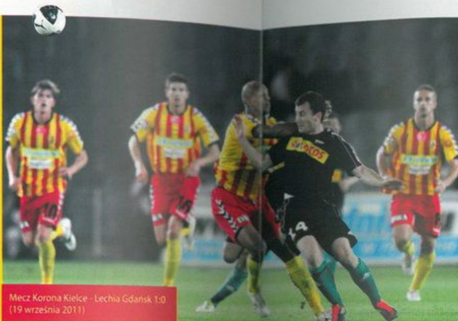
Mecz Korona Kielce - Lechia Gdansk 1:0 (19 września 2011)