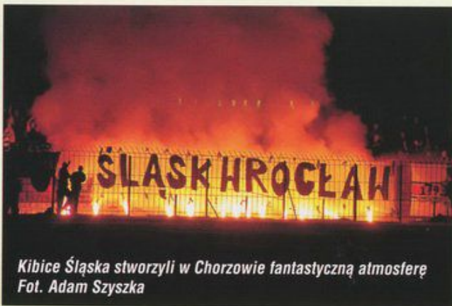
Kibice Śląska stworzyli w Chorzowie fantastyczną atmosferę

strzelców wpisał się Ćwielong . Piłkarze Śląska nie stwarzali zagrożenia pod bramką wywala ze stałych fragmentów gry, natomiast gospodarze pokazali w 61 minucie jak powinno się wykorzystywać rzuty wolne. Groźną akcją przerwał Sztylka , jednak zagrał piłkę ręką i „Niebiescy” otrzymali rzut wolny w odległości 25 metrów od bramki. Piłkę trącił Ćwielong , a Bonk precyzyjnie uderzył i futbolówka tuż przy słupku wpadła do siatki. Trener Kubik postawił wszystko na jedną kartę i na murawie pojawił się Kowal , by jeszcze bardziej wzmocnić ofensywę. Gospodarze grali jednak jak z nut i gdyby nie umiejętności Janukiewicza oraz odrobina szczęścia (w 73 minucie piłka po uderzeniu Ćwielonga trafiła w poprzeczkę) to porażka Śląska byłaby dużo wyższa.