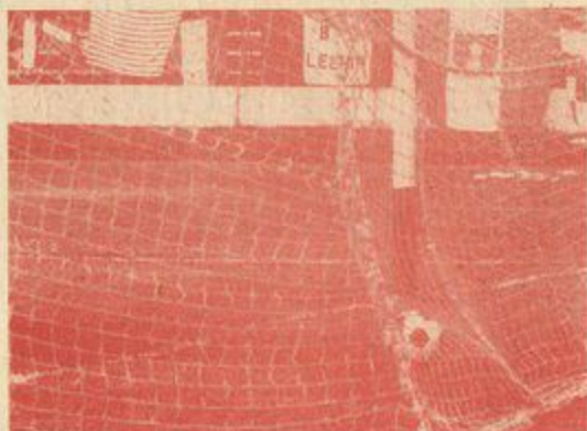
Nikomu się nie życzymy, aby wobliło nas takie jak to spotkanie oglądać po stronie rywali...

Chcesz uprawiać piłkę nożną, lekkoatletykę, tenis, kolarstwo, podnoszenie ciężarów lub rugby, zgłoś się w naszym klubie! Lechia czeka! - Zapraszamy!