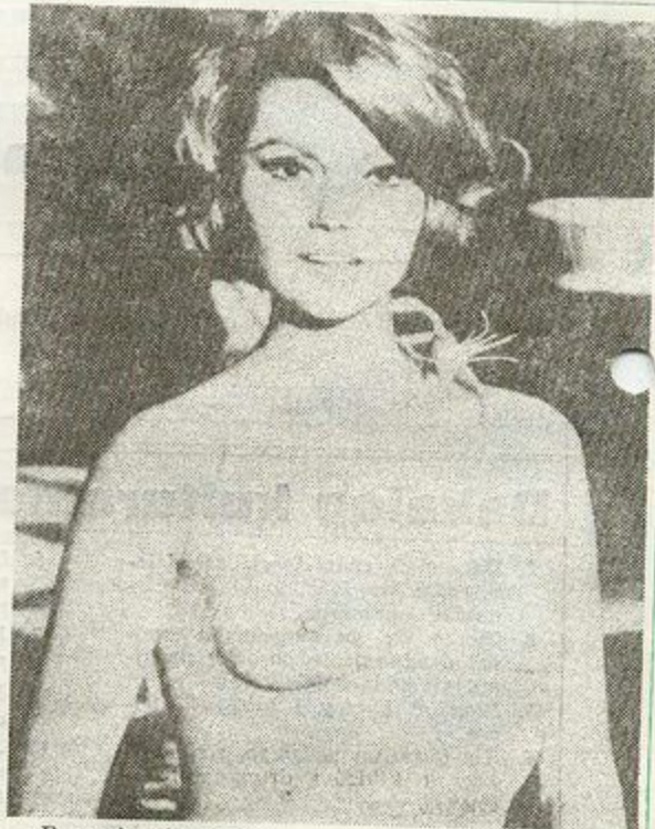
— Panowie, strzelajcie!

Rzecz jasna we wszelkiego rodzaju tabelach wszechczasów nie może równać się z dzisiejszym rywalem. W tabeli pierwszoligowej Lechia 21 miejsc z 298 punktami. Zagłębie melduje się na miejscu 40. Jeszcze gorzej wygląda to w drugiej lidze. Gdańszczanie są na czwartym miejscu, a my na... 61. Różnica punktowa wynosi 442 pkt.