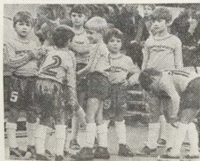
● Юная смена.