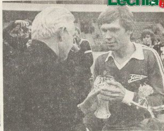
● Постоянные зрители на турнире народный артист СССР К. Ю. Лавров и дважды Герой Социалистического Труда В. А. Смирнов (он вручает приз Н. Воробьеву, 1986 г.).