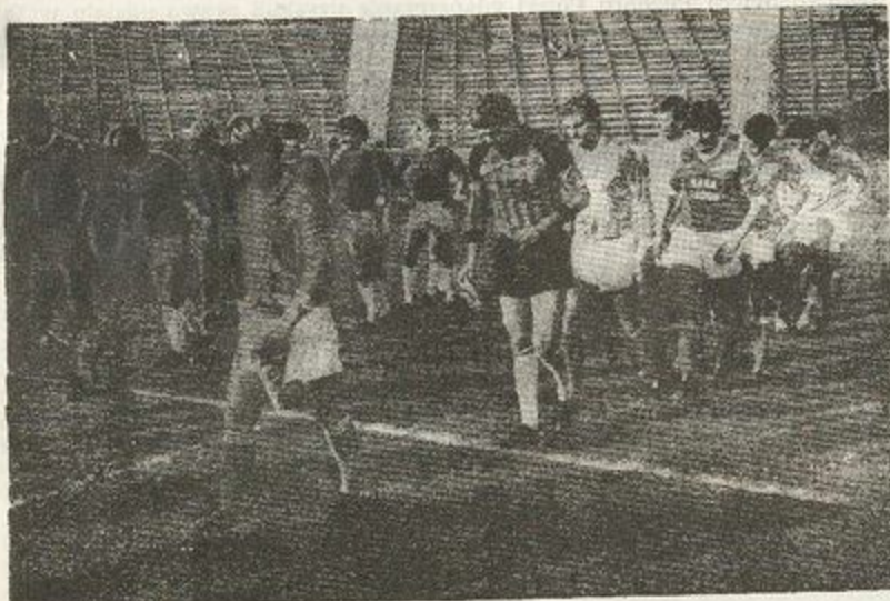
Drużyny Zagłębia Lubin i Lechii Gdansk wychodzą na boisko, by rozegrać mecz I-ligowy w dniu 29.IX.1985 r.