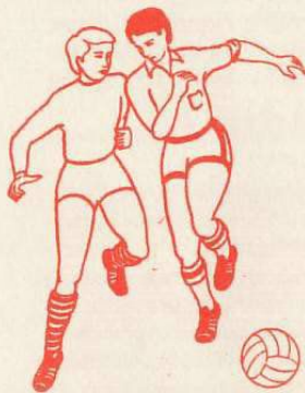
Gra dozwolona — walka o piłkę bark w bark.