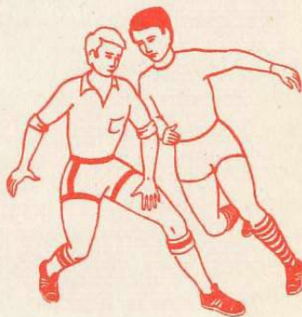
Gra niedozwolona — atakowanie przeciwnika bez piłki.