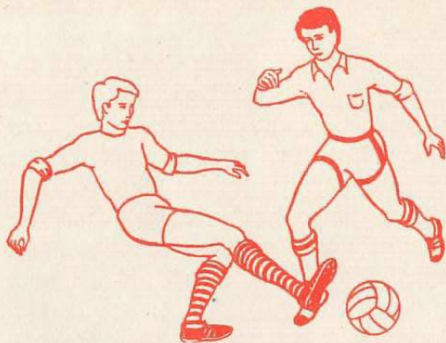
Gra niebezpieczna, niedozwolona — nakładka.