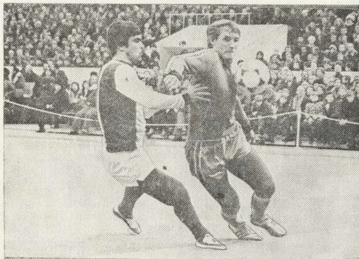
● Эпизод матча «Зенит» — «Тракия» (1982 г.).