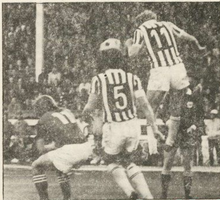
Słynny Juventus na stadionie we Wrzeszczu! To był pierwszy mecz w historii klubu.

Adres klubu — Gdańsk-Wrzeszcz, ul. Traugutta 29. Tel. 41-25-70.