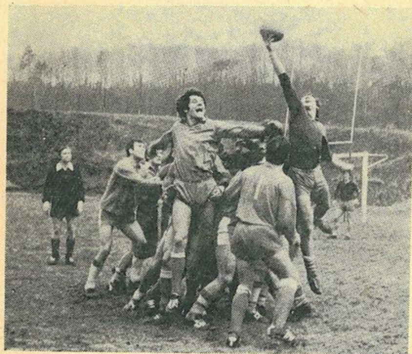
W-ce Mistrz Polski 1972/73